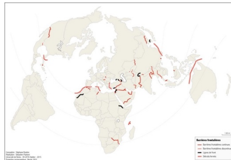
Routes d'exil dans le monde

La question indispensable du cadre politique qui tient ensemble des sociétés (empire, Etat-nation, Etat) se remodèle sans cesse, autant que les frontières depuis la fin des empires, la fin du monde bipolaire, la crise du système d'Etat-nations, la perte de pouvoir des Etats, la destabilisation profonde des relations internationales, la reconfiguration de « blocs » dans la géopolitique mondiale où les règles des Etats disparaissent, le rôle des villes 84 , avec de nouveaux acteurs formels et informels, de nouvelles activités qui s'intensifient. Elles échappent aux Etats et aux structures internationales (ONU). L'espace Schengen, espace de libre-marché (mouvement des capitaux, des biens, des populations) est un des lieux de « libre-circulation », des maffias, des passeurs, du crime organisé en Europe mais pas le seul sur la planète.