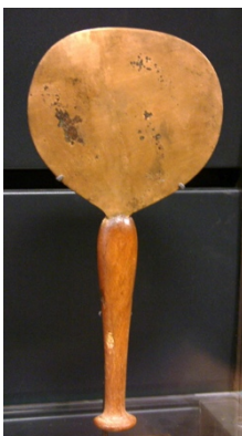
Miroir égyptien en bronze, 1200 ans avant J._C.

Un panorama en miroir peut être utile pour saisir pourquoi financer Frontex n'est ni une fatalité, ni une bonne idée.